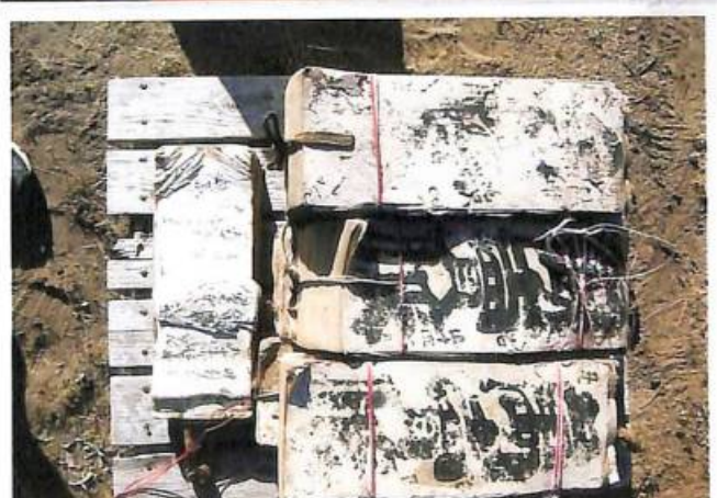
新友にむけたもの 別分 (明治の商売)