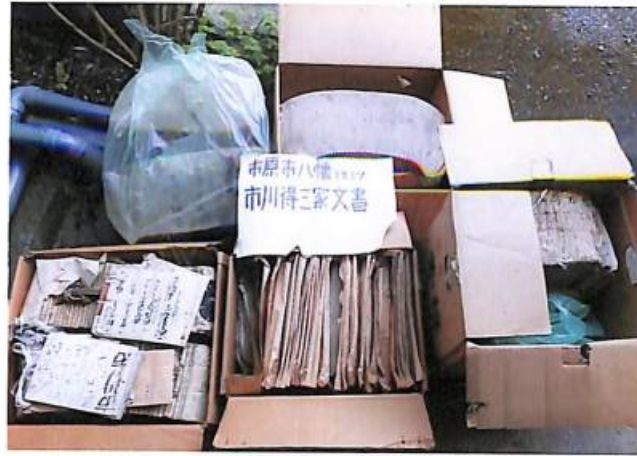
近世文書調査記録分 (市川得三)