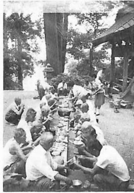
加茂公民館利用者名及其その状況