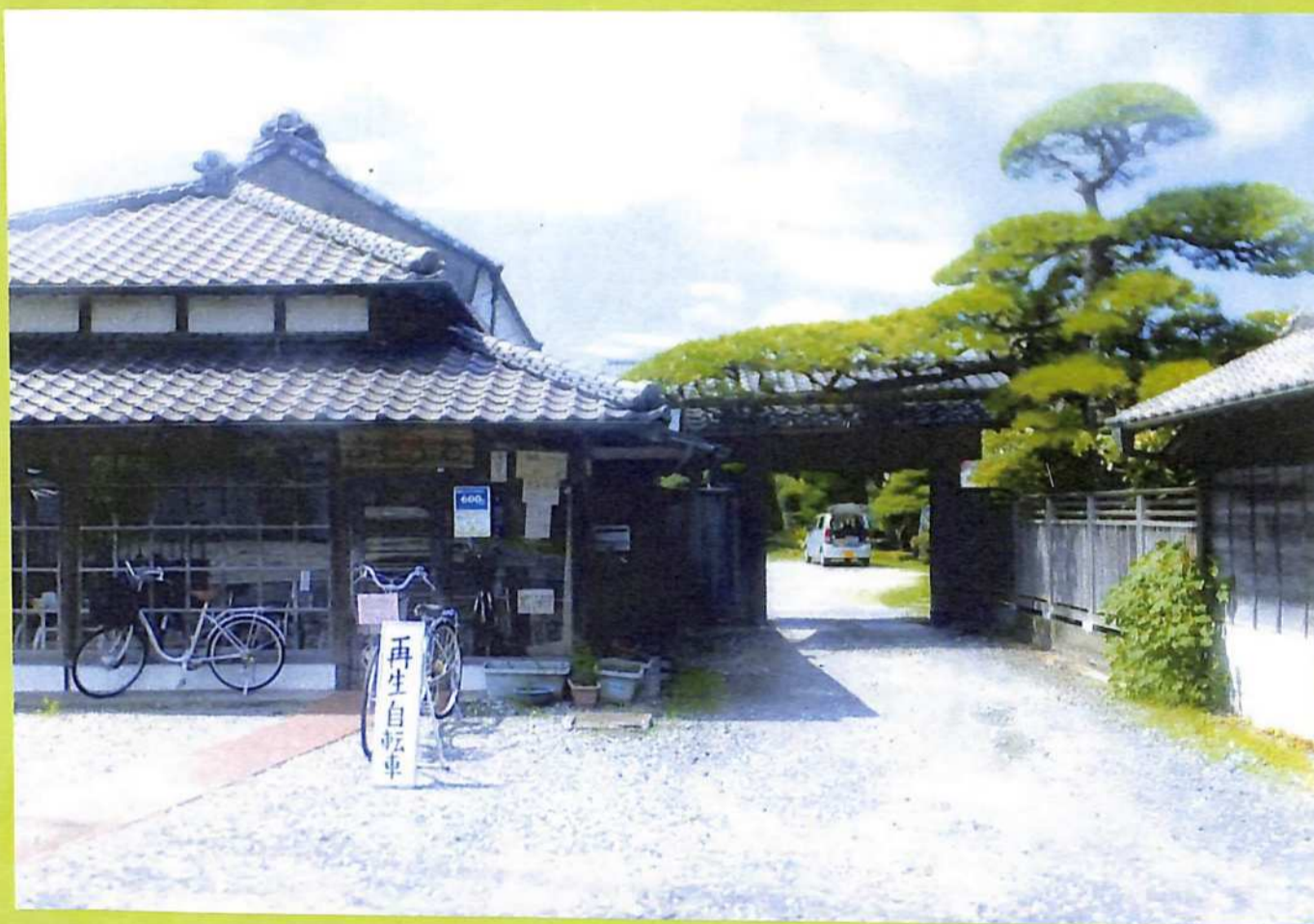
⑨ 米穀薪炭の問屋が立ち並んだ