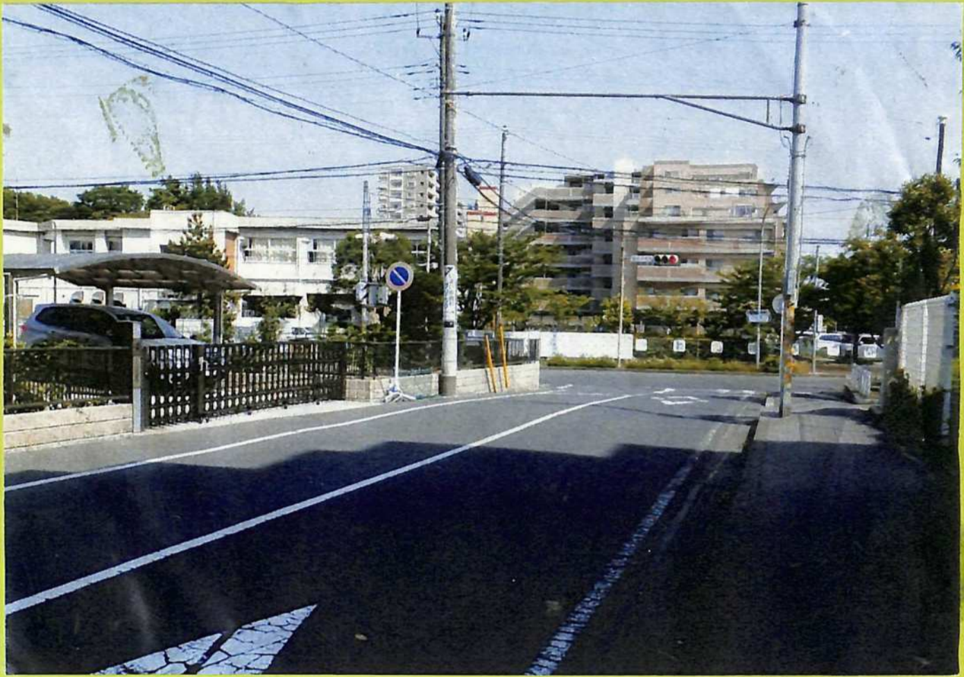
③南町みお横みおと大名領蔵屋敷跡