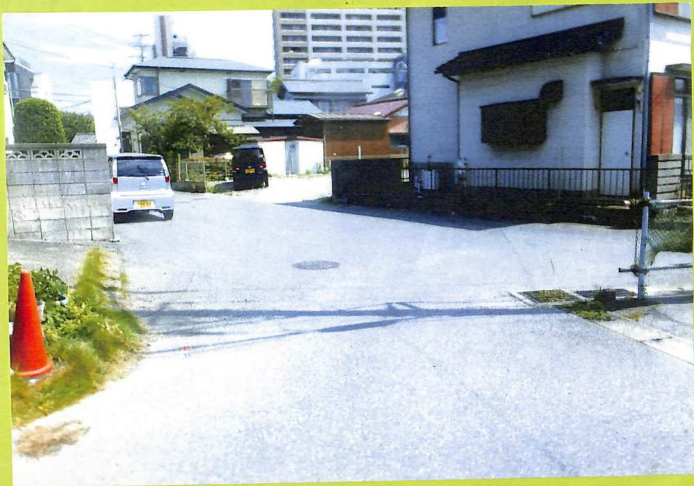
⑨ 旧道宿場町のクランク枡形跡