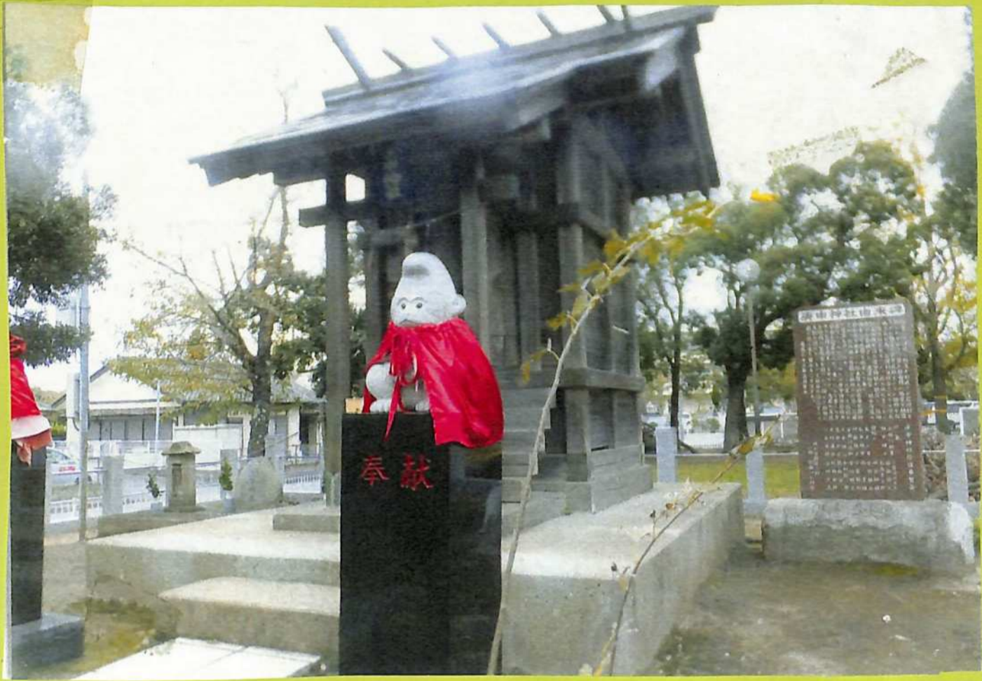
③石塚の由来碑と庚申塚跡