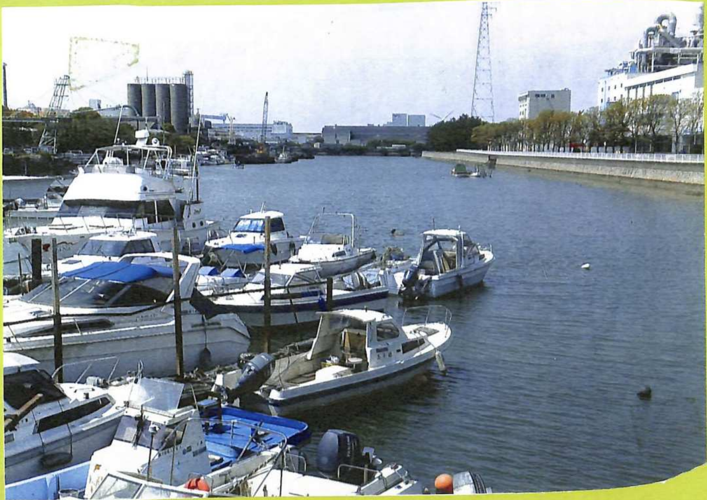
⑧五大力船が通ったみお筋