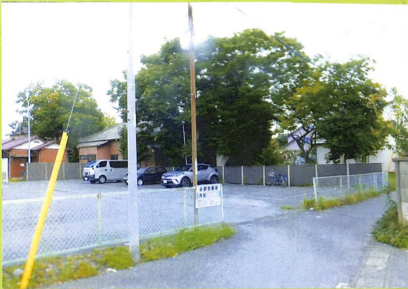
⑥ 五大力船関係者が多かった