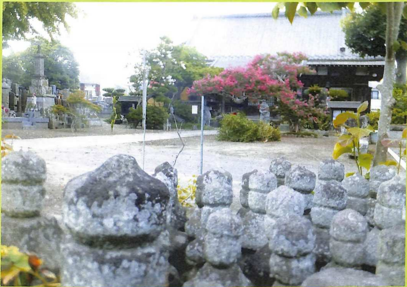
⑤ 称念寺の五輪塔群