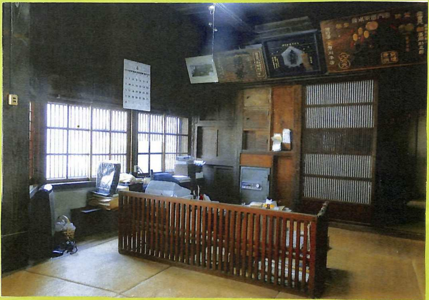
④箱階段のある帳場 (立ち入りはできません)