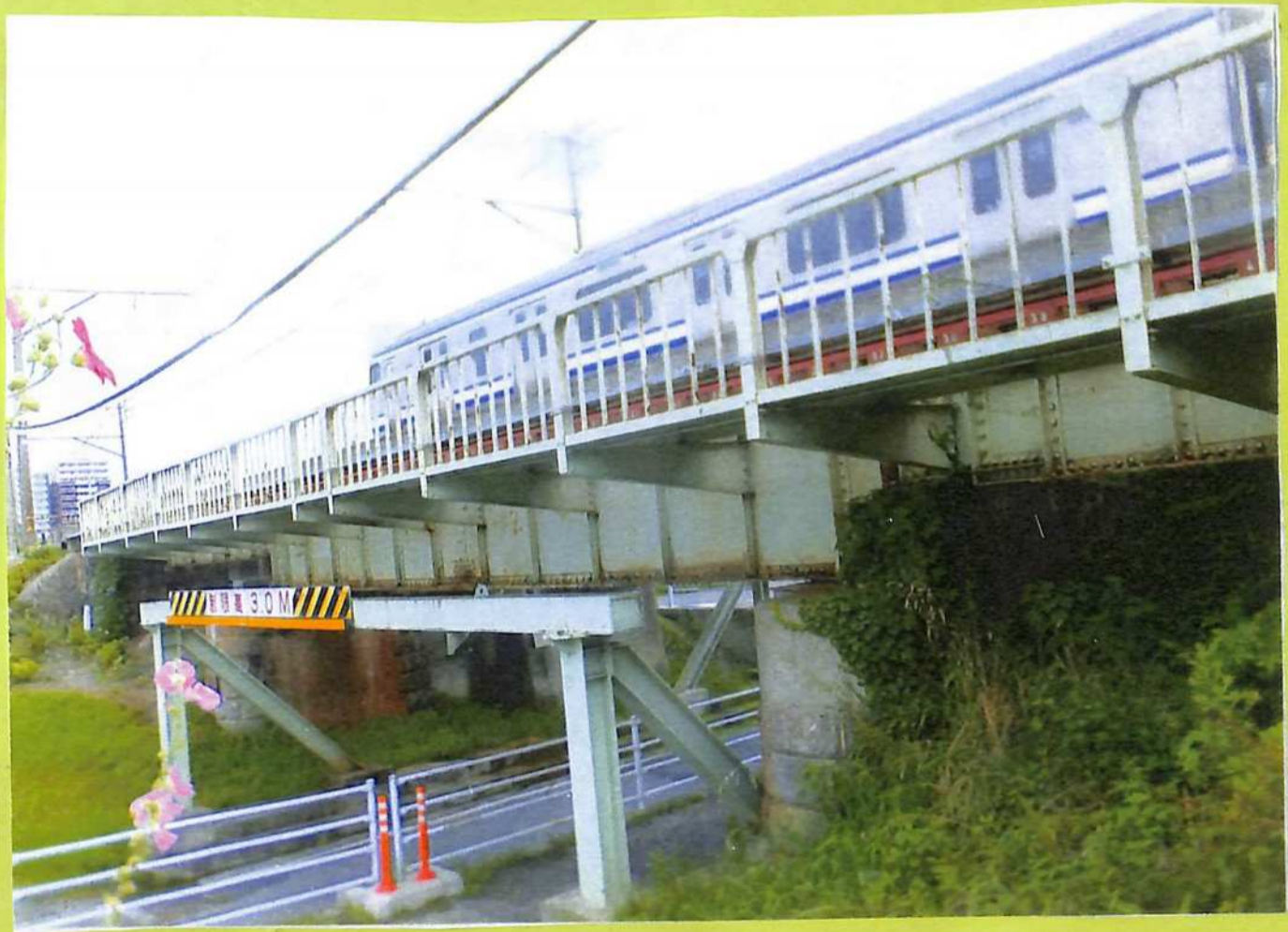
①蒸気機関車以来の煉瓦積み鉄橋