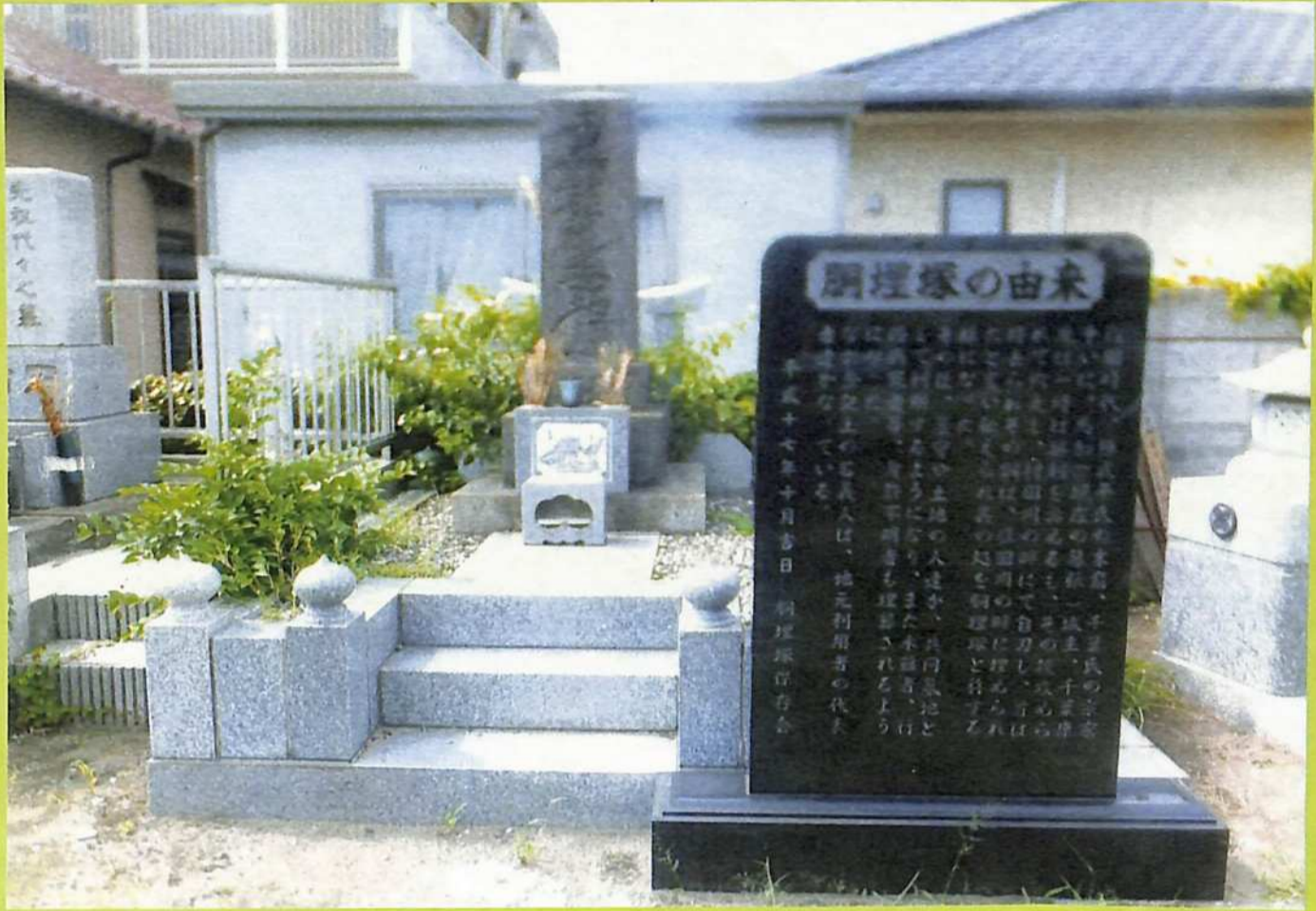
②千葉康胤討死の由来碑