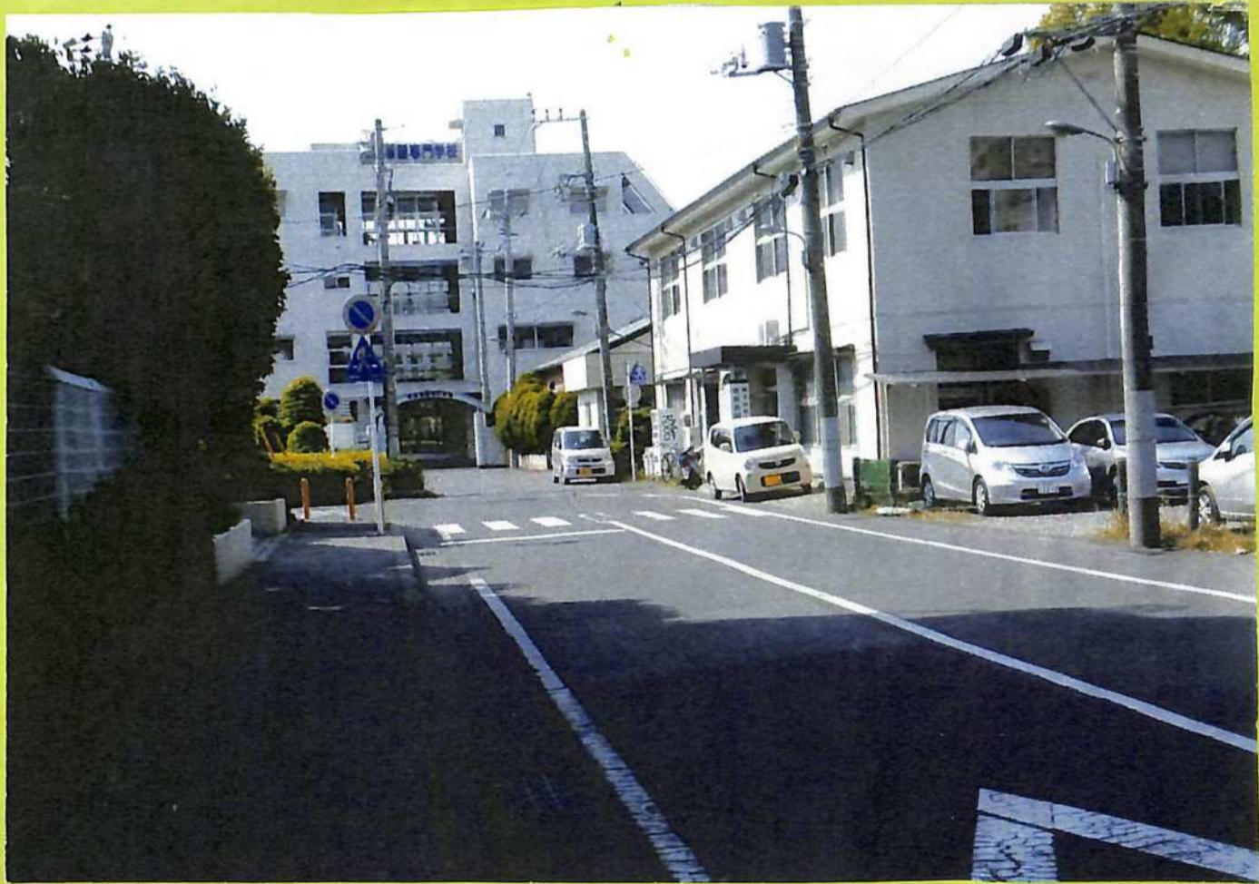
③慶長 19 年に築港された南町みお跡