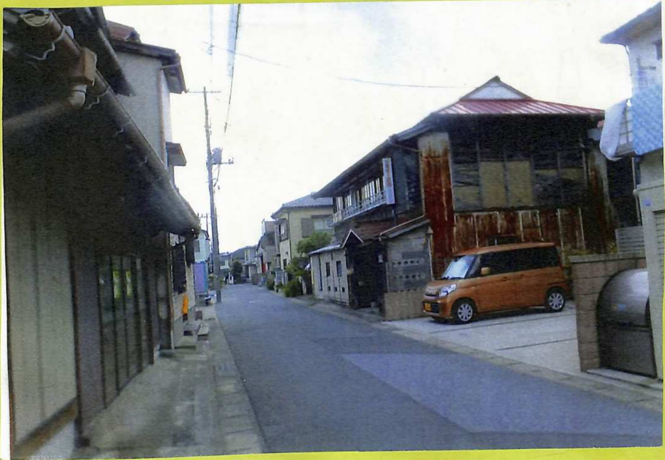
⑦料亭と海の家魚惣