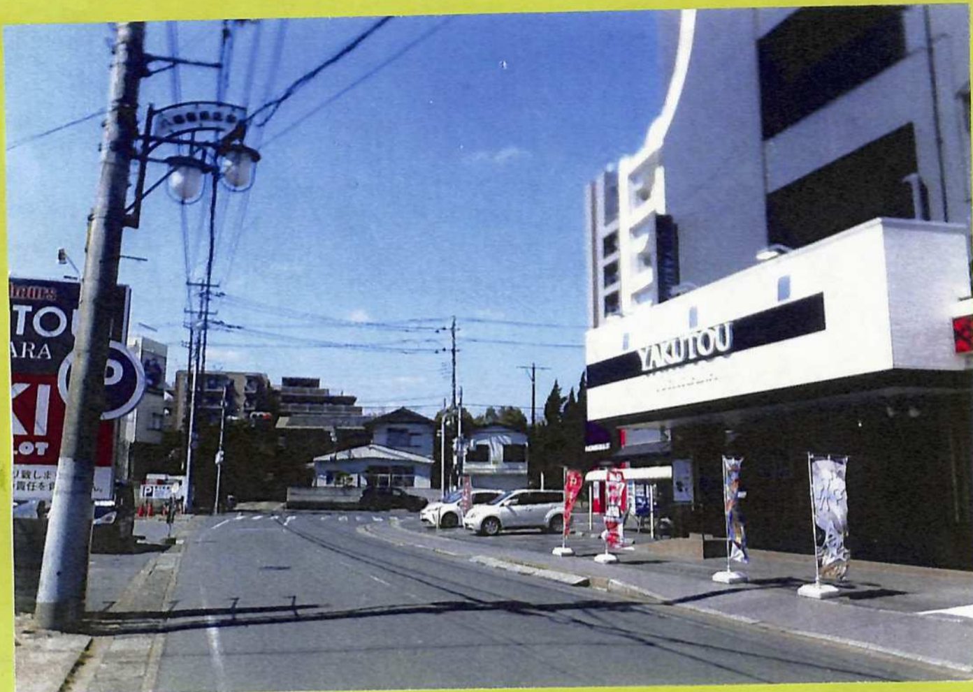
⑨ 郡内の産物や人の出入り口市原出途