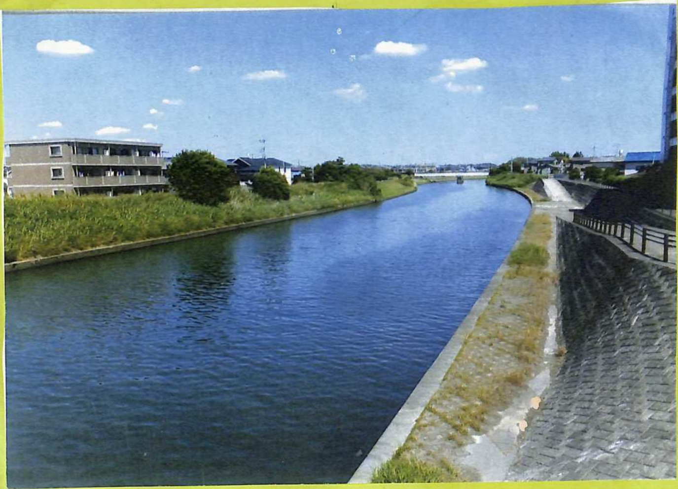
①昭和 29 年改修の現在の村田川