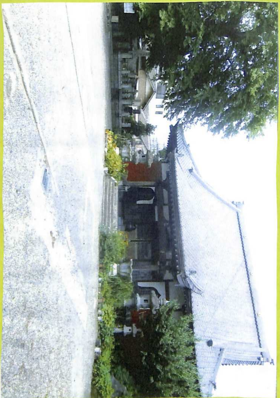
⑤ 千葉氏ゆかりの無量寺