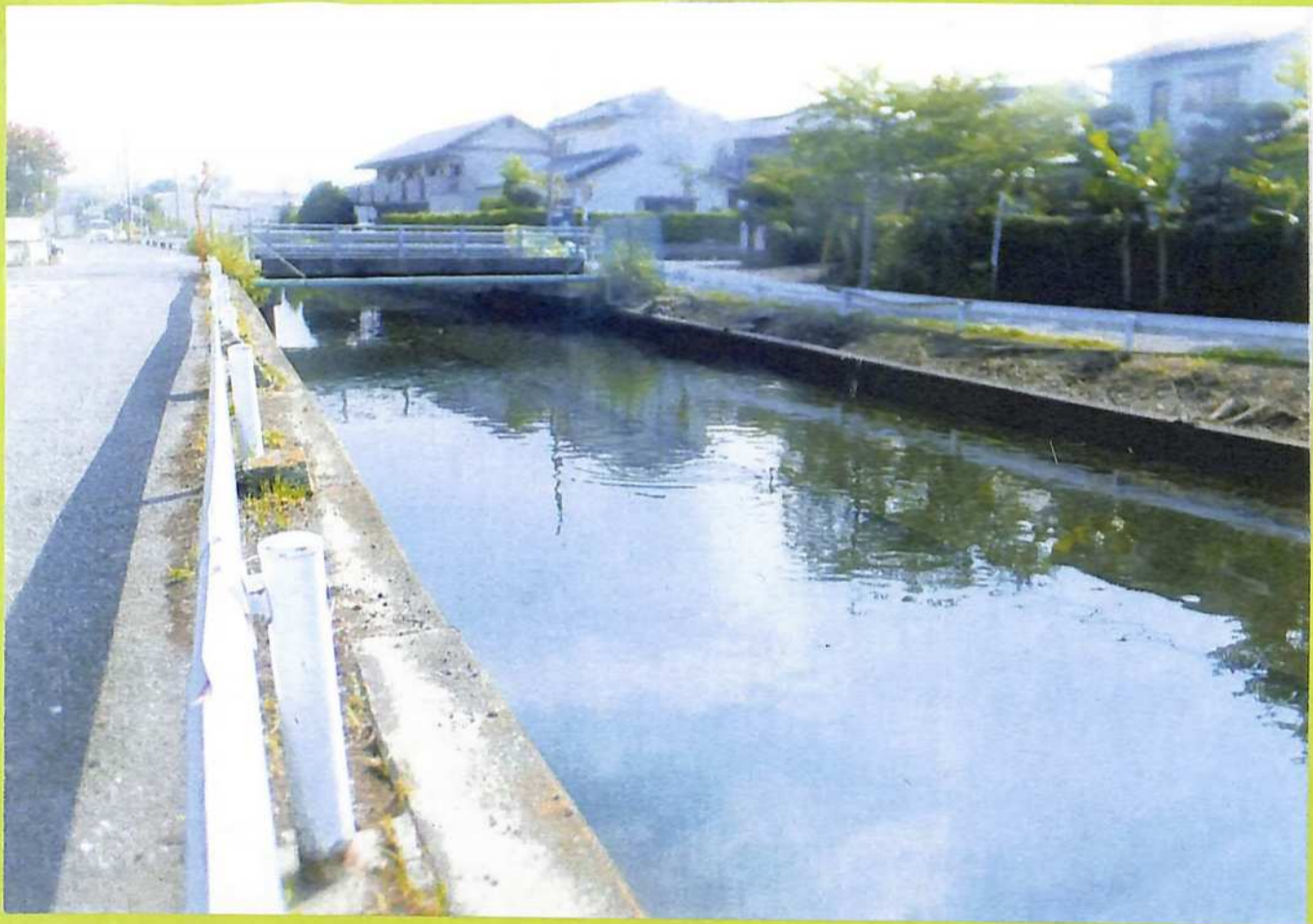
②富士山が望めた富士見橋