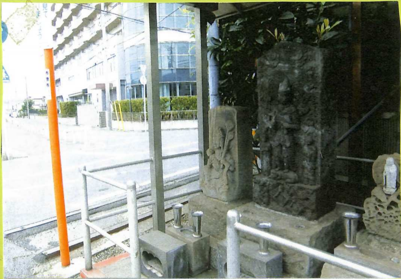
④観音町入口の東金道道標