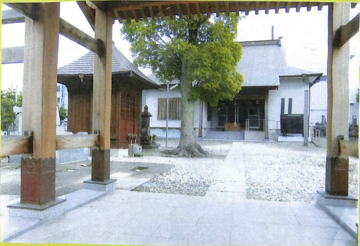
⑭元霊応寺塔頭首座の満徳寺