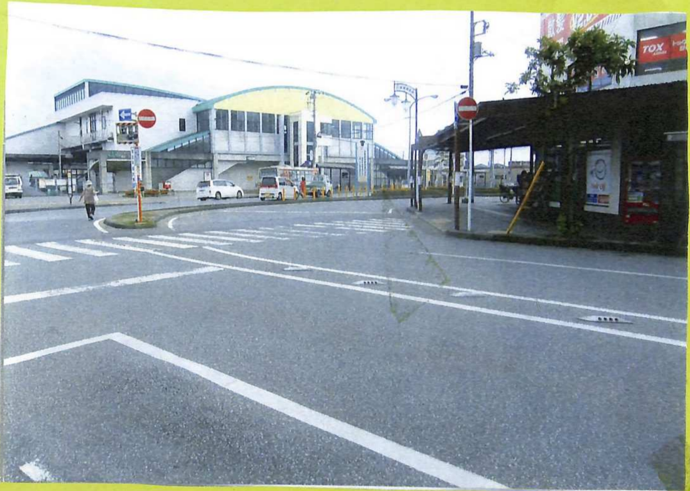
⑱八幡宮別当寺・霊応寺跡