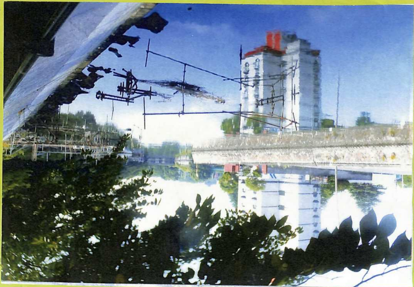
⑨湊町の面影が残る旧岸壁