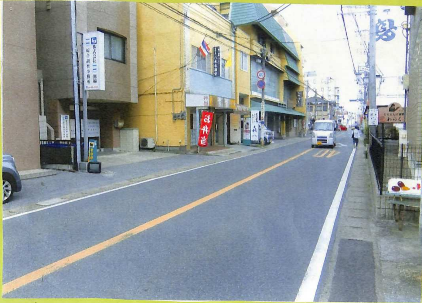
⑫房総往還宿通りと八幡宿