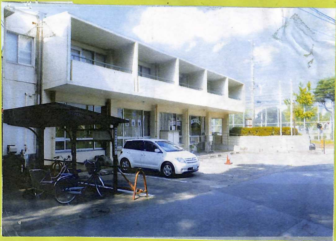
① 地域文化の殿堂・八幡公民館