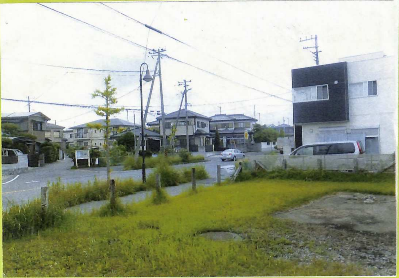
⑩浜本町横みおと豎みお