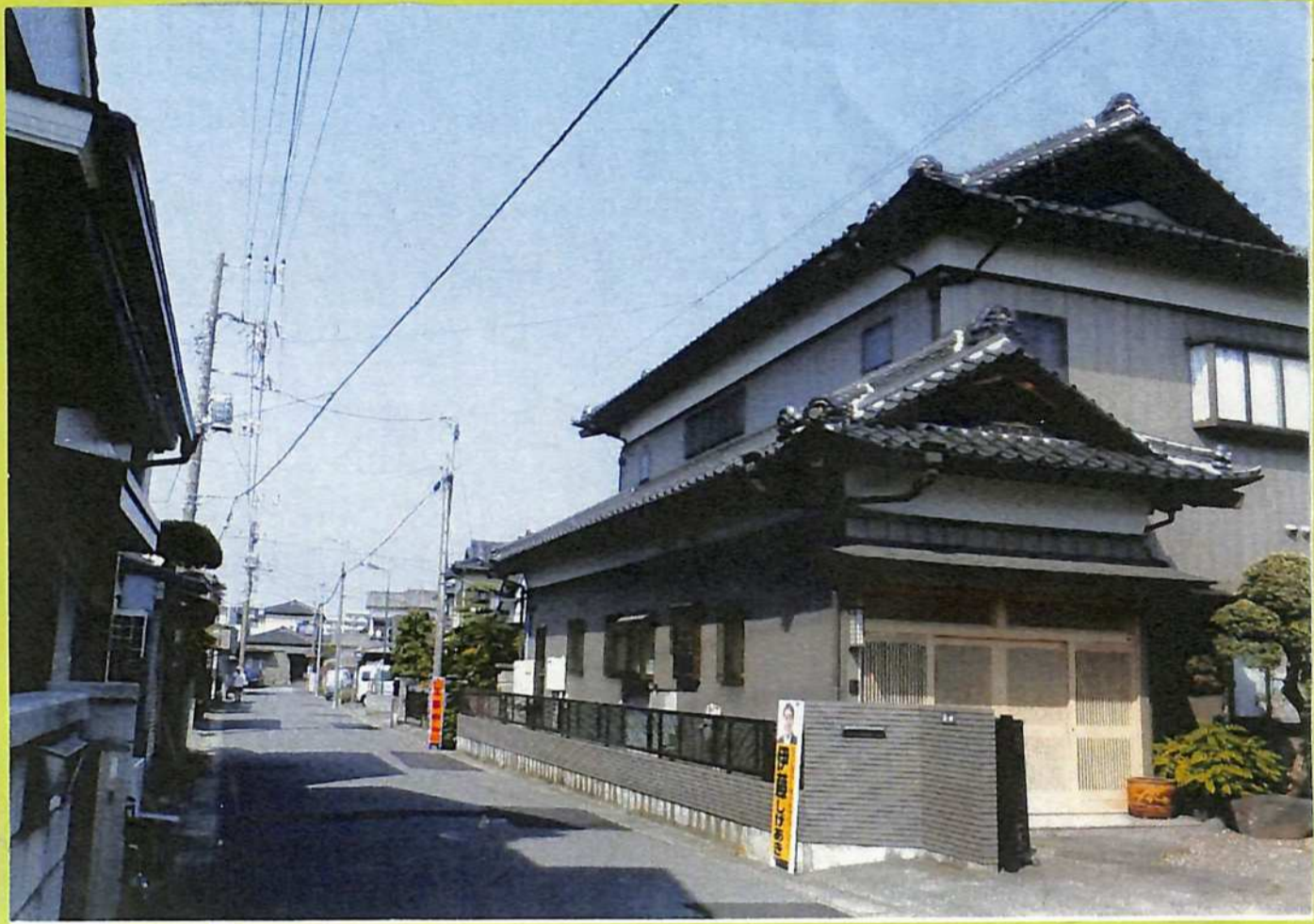
⑥ 浜本町倉町の町並み