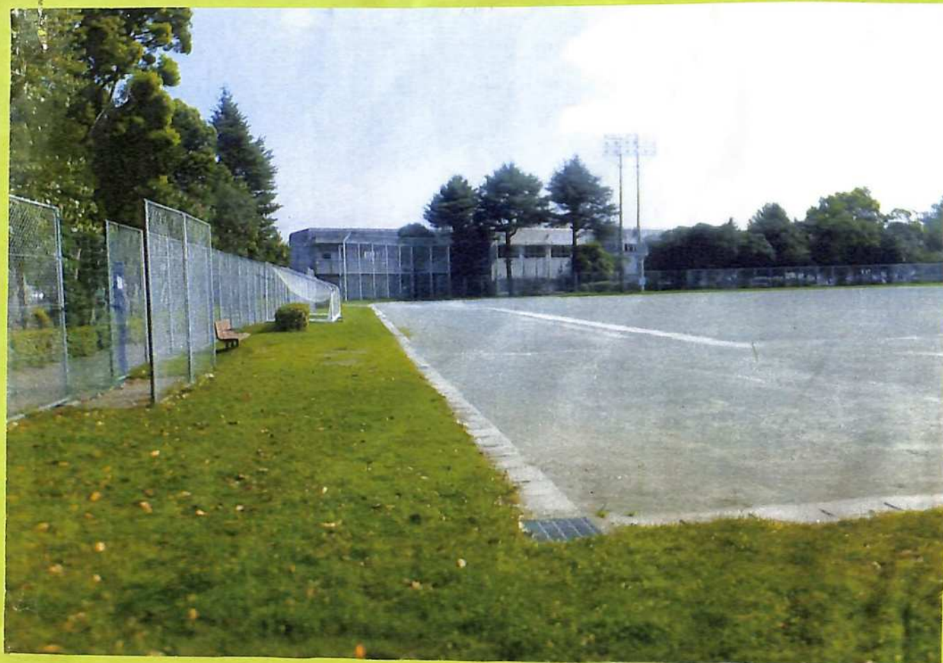
② 町民の勤労奉仕で作った運動場