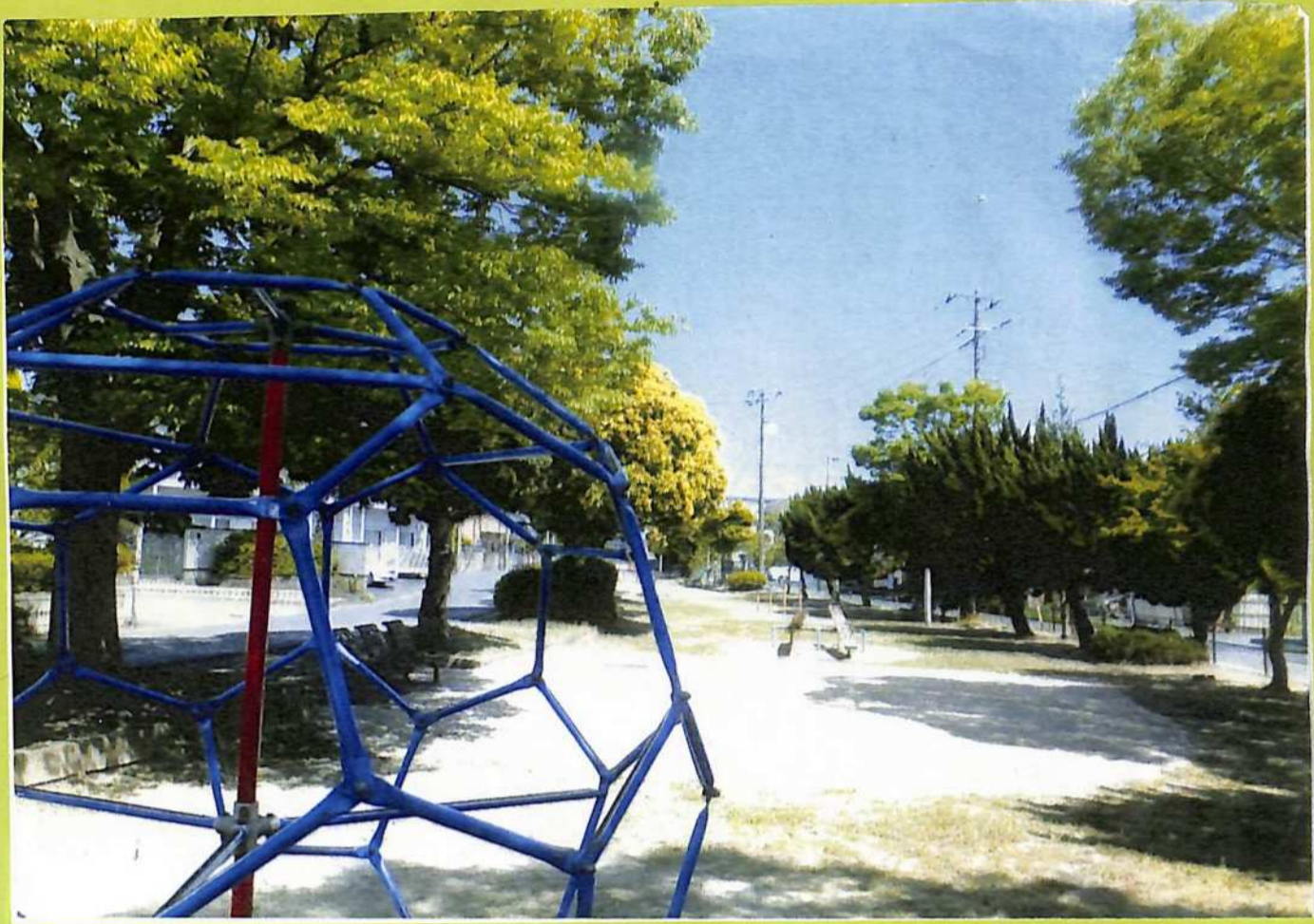
①下総との境川・村田川渡船場跡