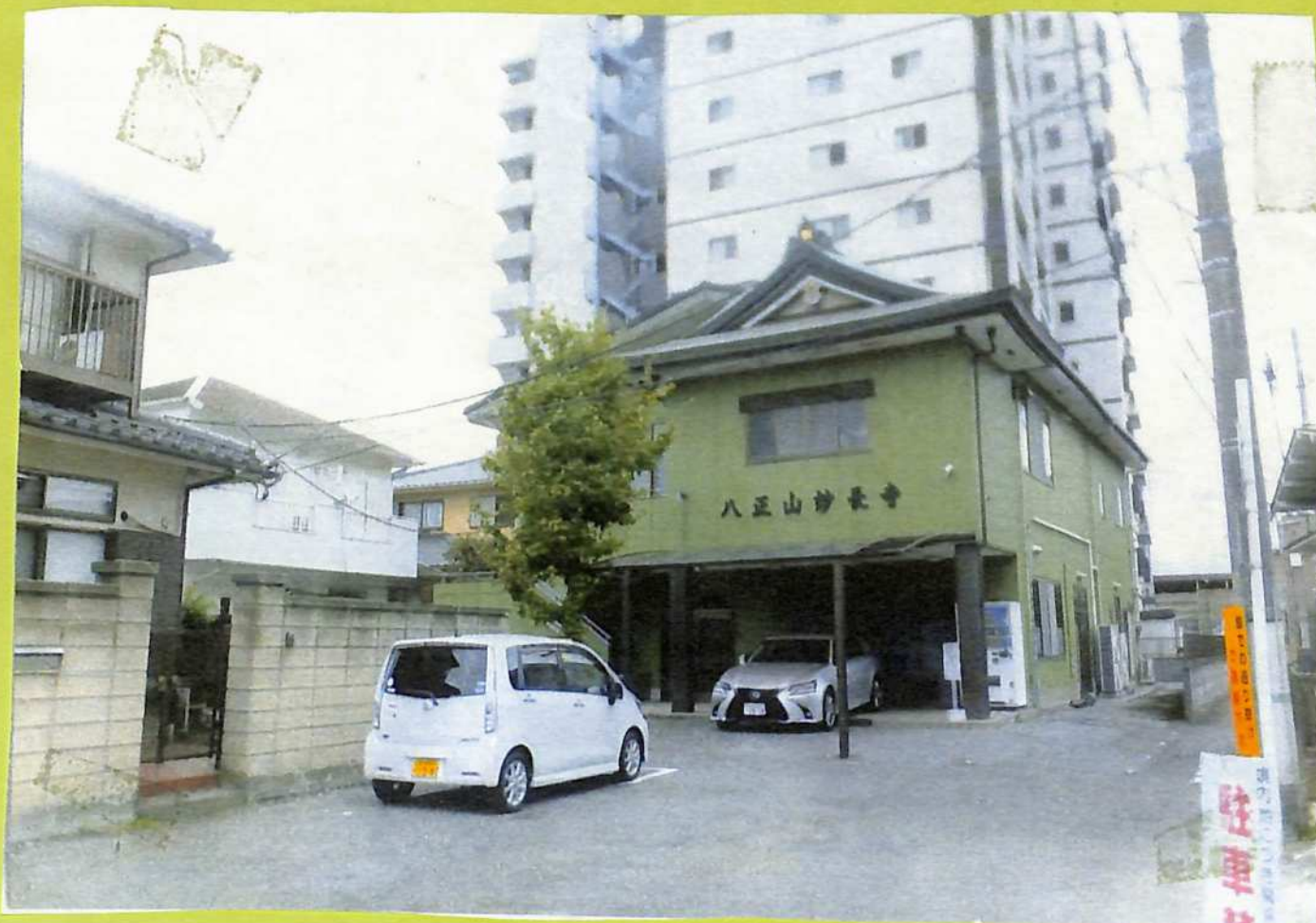
⑦ 正長2年創建伝える妙長寺