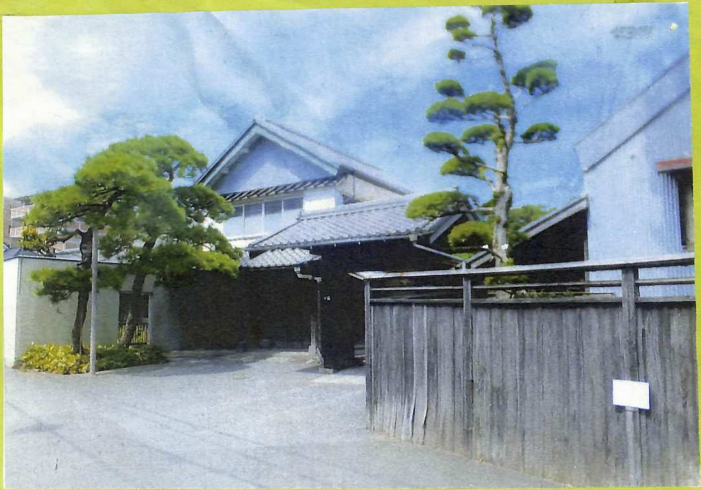
④江戸後期、明治建築の市川本店