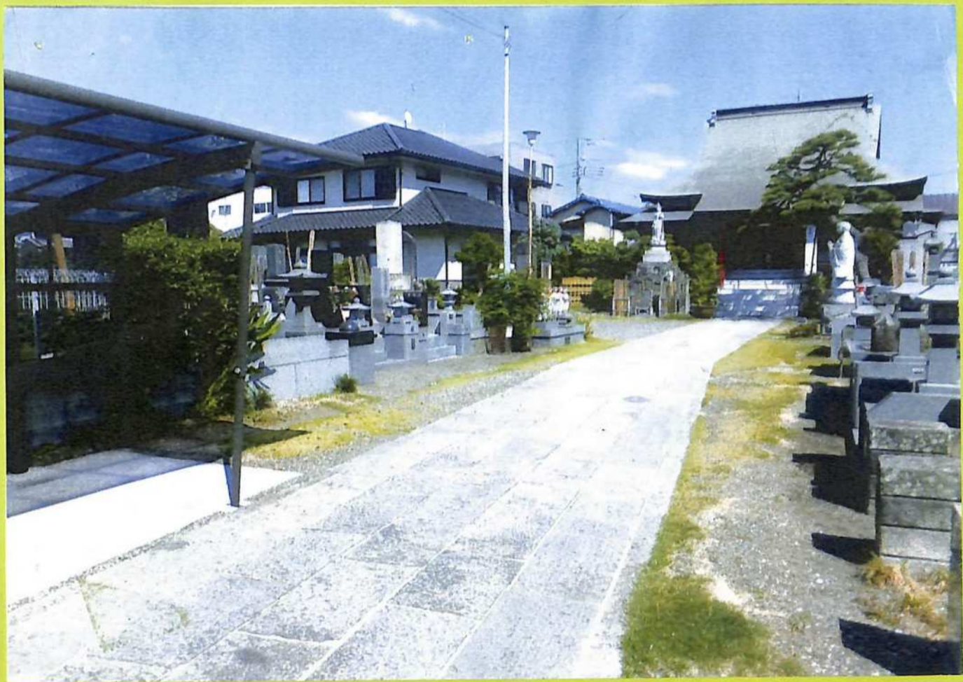
⑥本行寺隠居寺として創建円頓寺