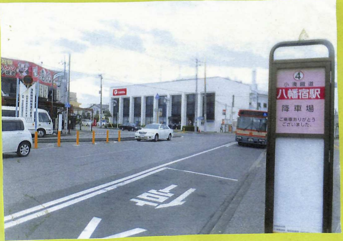
⑰明治～昭和歩んだ八幡小学校跡