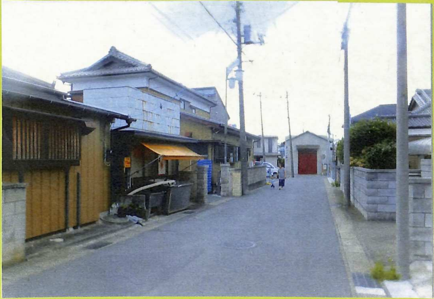
⑥河岸町だった浜本町