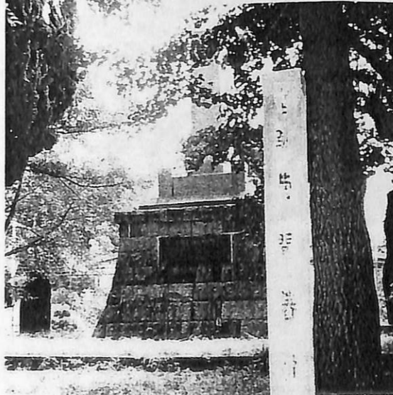
菊間藩庁跡の標柱・後ろは忠霊塔