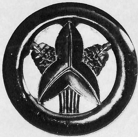
菊間藩・沢瀉紋（藤田屋所蔵）

これについては、市川、船橋戦争と戦いを進めて南下した房総の戊辰戦争として、いつか取り上げてみたいと思っている。