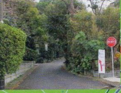
旧道より平成通り方面へ

この道はかつて房総往還と呼ばれ、市川から安房方面へとつながっており、近世においては参勤交代や物流などの重要な道でした。