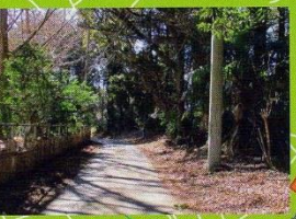
椎津新田会館より袖ヶ浦方面へ